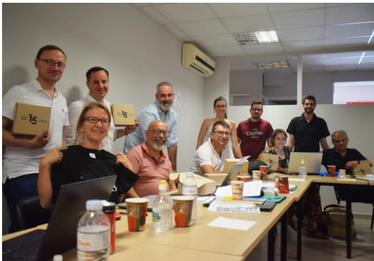
Η ομάδα που εργάζεται στο έργο κατά τη διάρκεια της συνάντησης στην Αθήνα

Αυτή η συνάντηση, όσο δύσκολο κι αν ήταν να οργανωθεί, ιδίως για τα ταξίδια και τους περιορισμούς της, τελικά επιτεύχθηκε.