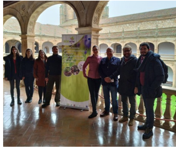
Βιβλιοθήκη Colegio de Fonseca

Η διακρατική μας συνάντηση έληξε το μεσημέρι της Τετάρτης, 7 Δεκεμβρίου στην Ιστορική Βιβλιοθήκη του Colegio de Fonseca, όπου συζητήσαμε τη διάδοση και τη διαχείριση του έργου Ecooils.