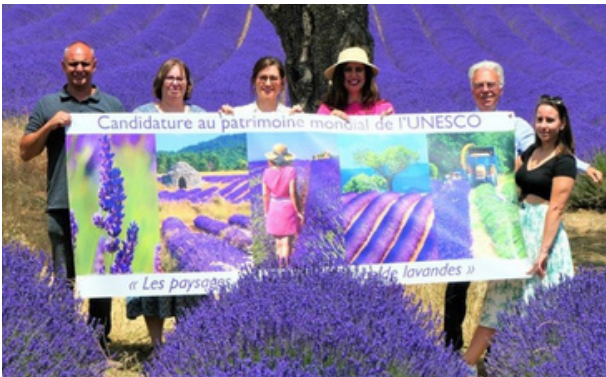
Ένωση Επαγγελματιών αρωματικών και φαρμακευτικών φυτών στη Γαλλία (PPAM de France)