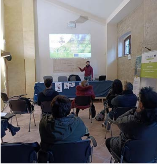
Τελική εκδήλωση στο Campobasso, Ιταλία!