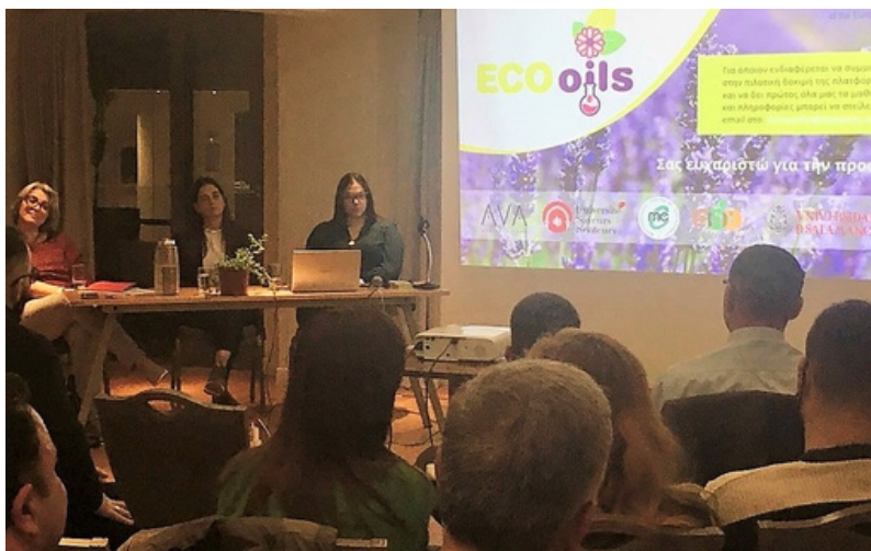
Εκδήλωση στην Αθήνα

Με επιτυχία διοργανώθηκε στην Αθήνα η εκδήλωση «Δυνατότητες Αξιοποίησης των Αρωματικών & Φαρμακευτικών Φυτών» από το Μεσογειακό Κέντρο Περιβάλλοντος-Ελλάδας. Η εκδήλωση, συγκέντρωσε πάνω από 40 συμμετέχοντες, παραγωγούς, μηχανικούς, εκπαιδευτές, επαγγελματίες του τουρισμού και φοιτητές.