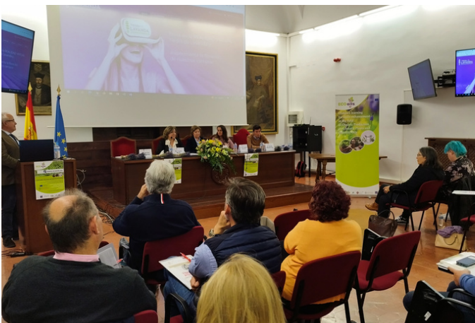
Τελική εκδήλωση στην Salamanca, Ισπανία

Κατά τη διάρκεια του Συνεδρίου, οι συμμετέχοντες είχαν την ευκαιρία να ανταλλάξουν γνώσεις και εμπειρίες στον τομέα, καθώς και να ανακαλύψουν διαφορετικές αισθητηριακές εμπειρίες με αρωματισμούς και στρογγυλά τραπέζια με ανοιχτές συζητήσεις